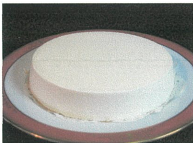
レアチーズケーキ ¥2,056 (¥2,220 税込)