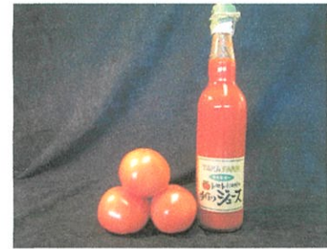
FARMKEI トマトジュース ¥1,112 (¥1,200 税込)