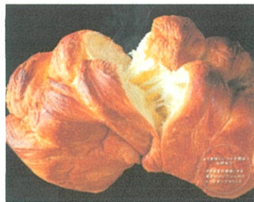
和の結 (デニッシュパン) ¥1,500 (¥1,620 税込)