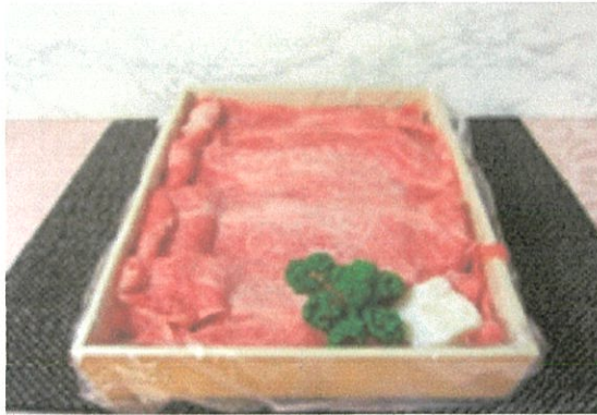
近江牛肉 800g (各種) ¥10,000 (¥10,800 税込)