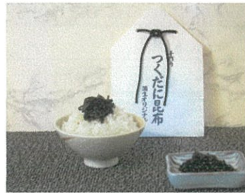
自家製 佃煮昆布 ¥500 (¥540 税込)