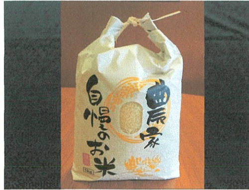
近江米コシヒカリ ¥2,482 (¥2,680 税込)