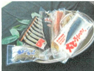
干物セット ¥2,315 (¥2,500 税込)