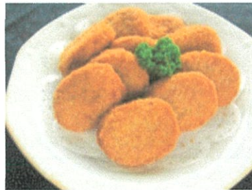
近江コロッケ(10個入) ¥1,204 (¥1,300 税込)