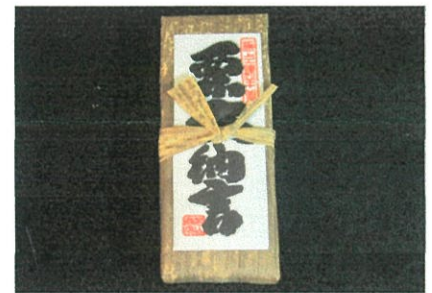
栗大納言羊羹 ¥1,250 (¥1,350 税込)

その他、豊富な品揃えからお選びいただけます。 参加人数ご予算に応じて、蒲生オリジナルプランを ご提案させていただきます。