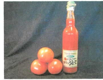
FARMKEI トマトジュース ¥1,300 (¥1,404税込)