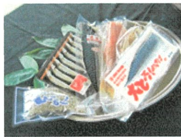
干物セット ¥2,500~ (¥2,700~税込)