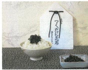
自家製 佃煮昆布 ¥600 (¥648税込)