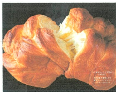
和の結 (テニッシュパン) ¥1,650 (¥1,782税込)