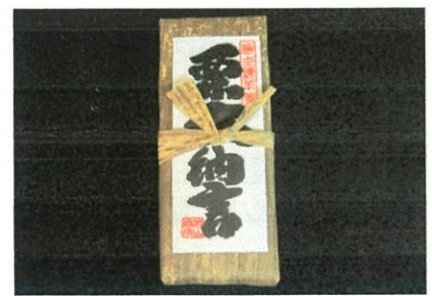
栗大納言羊羹 ¥1,400 (¥1,512税込)

その他、豊富な品揃えからお選びいただけます。 参加人数ご予算に応じて、蒲生オリジナルプランを ご提案させていただきます。