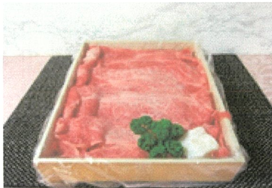
近江牛肉 600g (各種) ¥10,000 (¥10,800税込)