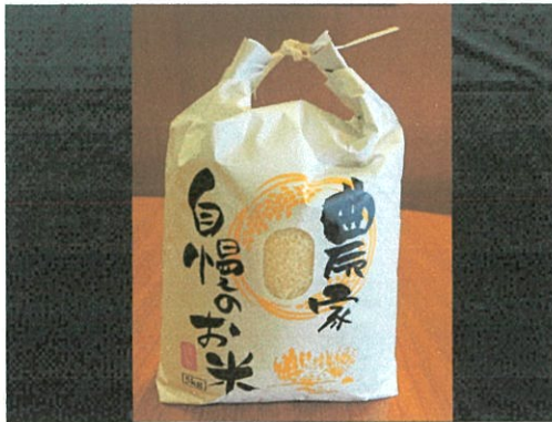
近江米コシヒカリ ¥2,500 (¥2,700税込)