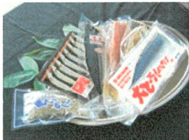
干物セット ¥2,500~ (¥2,700~税込)