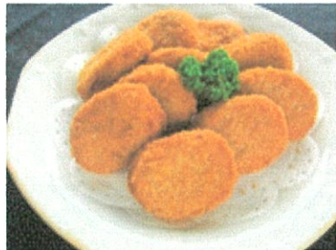
近江コロッケ(10個入) ¥1,700 (¥1,836税込)