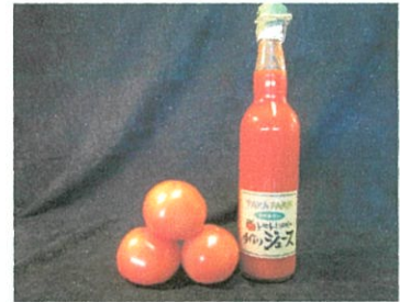
FARMKEI トマトジュース ¥1,300 (¥1,404税込)