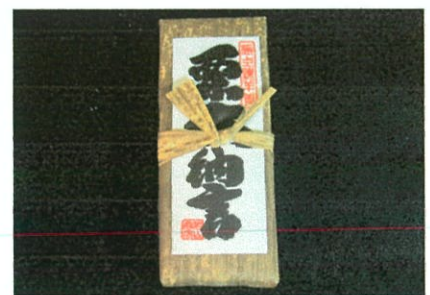
栗大納言羊羹 ¥1,400 (¥1,512税込)

その他、豊富な品揃えからお選びいただけます。 参加人数ご予算に応じて、蒲生オリジナルプランを ご提案させていただきます。