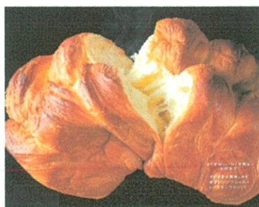
和の結 (ネニッシュパン) ¥1,650 (¥1,782税込)