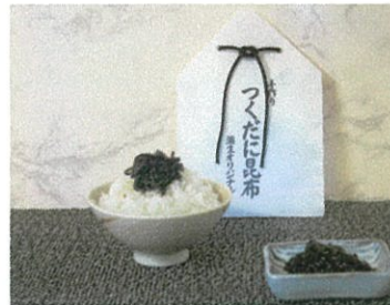
自家製 佃煮昆布 ¥600 (¥648税込)