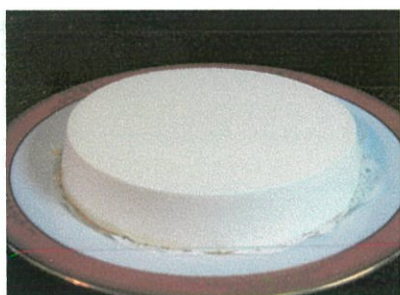
レアチーズケーキ ¥2,650 (¥2,862税込)