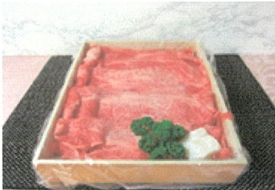
近江牛肉 600g (各種) ¥10,000 (¥10,800税込)